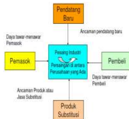
Gambar 1. Five Force Michael E. Porter (Sumber: Issakh dan Wiryawan, 2014).

industri, permintaan yang meningkat atau atau menurun dan perbedaan produk menentukan seberapa hebat akan terjadi persaingan di antara perusahaan-perusahaan itu sendiri (Issakh dan Wiryawan, 2014).