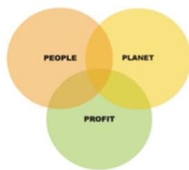
Triple Bottom Line CSR

memperhatikan keuntungan ( profit ), namun juga harus dapat memberikan kontribusi terhadap masyarakat ( people ) dan ikut aktif dalam menjaga kelestarian lingkungan ( planet ). Dengan demikian dalam upaya untuk menaikkan ketertarikan publik, program CSR perusahaan harus memperhatikan triple bottom line yang mencakup People, Planet, and Profit .