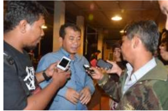
Gambar 4. Wawancara Wartawan dengan Walikota Bekasi

Media gathering rutin diadakan setiap tahunnya karena keberadaan wartawan di lingkungan pemerintahan sangat diperlukan. Baik wartawan media elektronik (televisi, radio), mupun media cetak (surat kabar, majalah), serta wartawan media internet. Selain dihadiri walikota, acara tatap muka dengan wartawan juga dihadiri sejumlah pejabat SKPD di lingkungan Pemkot Bekasi. Keberadaan pejabat di acara tersebut selain dapat mengenal secara langsung wartawan-wartawan resmi yang bertugas di lingkungan Pemkot Bekasi, juga dapat lebih meningkatkan keakraban kedua belah pihak. Hal itu dapat dilihat pada gambar 4 berikut ini.