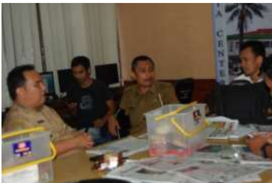
Gambar 2. Diskusi antara Wartawan dengan Staf Bagian Humas Setda Pemkot Bekasi

Dalam kesempatan tersebut, staf bagian humas bisa menyampaikan keluh kesahnya dengan santai tanpa ada tekanan kepada wartawan yang diajaknya berbicara. Sebaliknya wartawan dapat menyampaikan saran-saran berkaitan dengan topik bahasan yang diperbincangkan. Wartawan juga kerap menyampaikan keluh kesahnya berkaitan dengan fasilitas maupun hal lain yang berkaitan dengan informasi aktual di Pemkot Bekasi. Pejabat maupun staf di bagian humas dituntut bisa berkomunikasi dan menjalin hubungan baik dengan wartawan, meskipun masih banyak wartawan yang berpenampilan kurang rapi dan memiliki gaya komunikasi yang spontan.