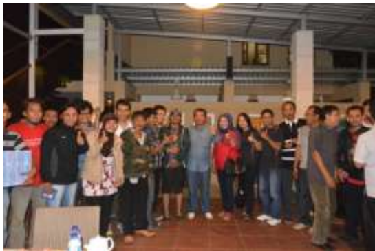
Gambar 3. Tatap Muka Walikota dan Wakil Walikota Bekasi dengan Wartawan

Agenda acara dalam media gathering adalah mendengarkan masukan-masukan dari wartawan dan berdiskusi mengenai topik-topik aktual yang terjadi di Pemkot Bekasi dan kebijakan-kebijakan Pemkot Bekasi. Pertanyaan dari wartawan langsung ditanggapi oleh Walikota dan Wakil Walikota Bekasi, Rahmat Effendi dan Ahmad Syaiku. Setelah acara tersebut selesai, diadakan pengundian hadiah. Setiap wartawan yang hadir di acara tersebut diberikan kupon untuk dapat diundi dan mendapatkan hadiah yang diantaranya berupa handphone , power bank , ipad , dll. Acara tersebut kemudian ditutup dengan karaoke bersama untuk lebih mengakrabkan dan mendekatkan antara wartawan dengan Walikota dan Wakil Walikota Bekasi. Pada gambar 3 merupakan dokumentasi Humas Setda Kota Bekasi pada acara tatap muka dengan Walikota-Wakil Walikota Bekasi.