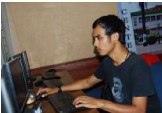
Gambar 5. Media Center Humas Setda Pemkot Bekasi

Dalam ruangan tersebut juga kerap digunakan untuk berdiskusi antara staf di Humas dan wartawan. Diskusi bisa formal dan non formal. Secara formal biasanya dilakukan melalui kegiatan konferensi pers. Namun diskusi kerap dilakukan secara non formal, dengan suasana yang santai. Diskusi membicarakan isu-isu aktual yang terjadi di Kota Bekasi. Berikut ini gambaran ruangan media center Humas Setda Kota Bekasi di mana ada salah seorang wartawan menulis berita dengan memanfaatkan komputer yang disediakan.